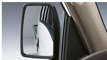
Gương chiếu hậu góc rộng

Bạn còn phải băn khoăn điều gì khi phải lựa chọn một chiếc xe cho công việc của mình? New Porter 150 sẽ cung cấp đầy đủ cho bạn.