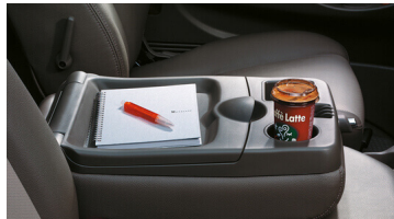
Giá để cốc tiện dụng