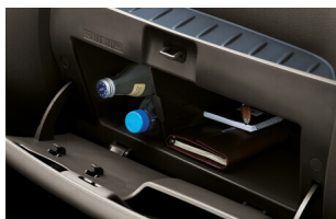
Hộc để đồ phía trước.