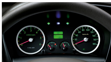
Đồng hồ hiển thị mang phong cách sedan.