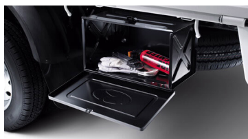
Hộp dụng cụ có sức chứa lớn

Thùng hàng New Porter 150 có sức chứa lớn cùng chiều cao tối ưu cho việc bốc xếp hàng hóa.