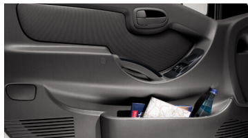
Hộc để đồ trên cánh cửa