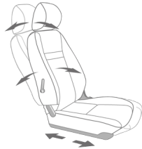
Ghế lái điều chỉnh vị trí

Hyundai New Porter 150 cung cấp một không gian lái thực sự thoải mái cho lái xe với những trang bị tiện nghi của một chiếc sedan. Hyundai hiểu rằng những tài xế xe tải luôn phải chịu những áp lực lớn trong mỗi chuyến đi, bởi vậy New Porter 150 đem đến một cabin nhiều tiện ích, chăm chút từ những điều nhỏ nhất để lái xe có thể có một hành trình an toàn cùng cảm giác thú vị khi cầm lái.