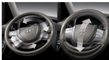
Vô lăng điều chỉnh góc lái.