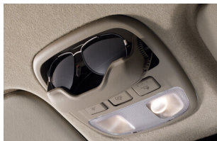
Hộc để kính và đèn trần.